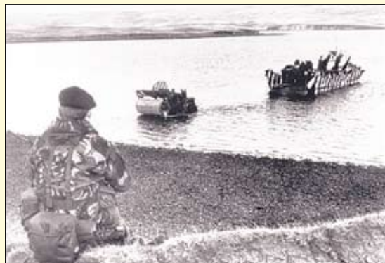
Comienza el desembarco inglés en las islas Malvinas.

A las 6:30 de la mañana del viernes 2, órganos de maniobra de las Fuerzas Armadas Argentinas, integrados en la FT 40 por el Batallón Infantería Marina 2, la Agrupación de Comandos Anfibios, una Sección de Infantería del R.Inf. 25 y la Compañía de Ingenieros 9, lograron desembarcar en Puerto Stanley y ocupar las islas. Luego de algunos enfrentamientos el gobernador británico se rinde ante el contralmirante Carlos Busser, al mando de las fuerzas de desembarco. Al