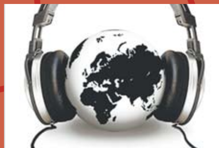
Escuela de Idiomas * Inglés. * Italiano. * China, Lengua y Cultura.