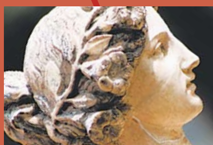
Escuela de Artes y Cultura * Gestión Cultural. * Historia del Arte. * Iniciación Teatral.