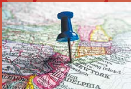
Escuela de Turismo * Turismo Cultural. * Guía Turístico.