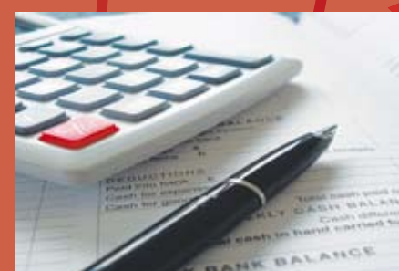
Escuela de Emprendimiento * Emprender Después de Jubilar. * Creatividad Publicitaria. * Gestión de Negocio.