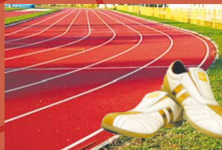
Escuela de Educación Física, Deportes y Recreación * Actividad Física y Vida Saludable. * Monitor Deportivo.