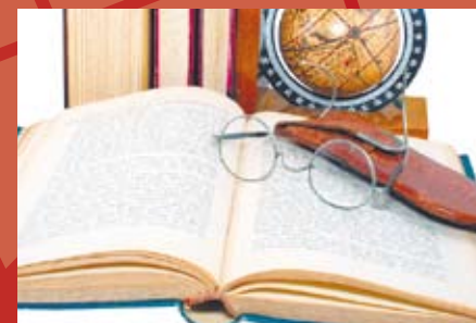
Escuela de Educación * Historia y Geografía de Chile. * Historia Universal. * Animación Socio Cultural.