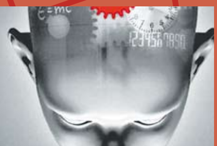
Escuela de Psicología * Procesos Afectivos y el Poder de las Emociones. * Dilemas de la Vida: Duelo, Separación, Pareja, Hijos.