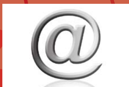
Escuela Digital * Computación. * Internet. * Diseño de Páginas Web.