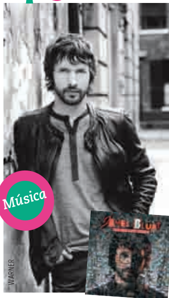
James Blunt: "All the lost souls" Precio de referencia: $9.990.