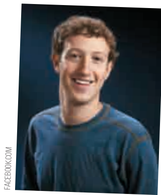
Mark Zuckerberg es el creador del sitio web más top del momento: www.facebook.com .