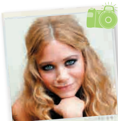
Mary Kate Olsen