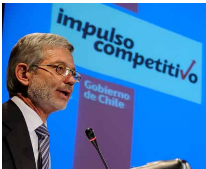
19/01/2011 Ministro de Economía anuncia resultados del trabajo de las mesas y los problemas identificados.